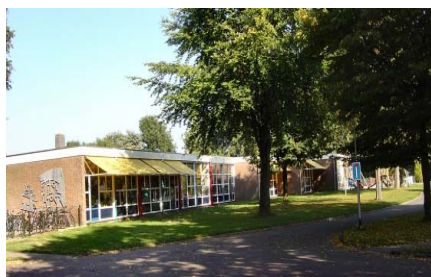
o.b.s. De Weiert

Het leerlingdossier is strikt vertrouwelijk. U heeft als ouder het recht om dit op school in te zien, maar u moet hiervoor wel een afspraak maken met de directeur. Het kan zijn dat de school het leerlingdossier van uw kind aan anderen wil laten zien, bijvoorbeeld aan de schoolbegeleider. Dat is alleen mogelijk als u daarvoor toestemming verleent. Omdat het leerlingdossier strikt vertrouwelijk is heeft OPO Borger-Odoorn afspraken gemaakt hoe om te gaan met leerlingdossiers. Deze afspraken zijn neergelegd in een protocol 'omgaan met leerlingdossiers'. Zowel leerkrachten als ouders dienen zich te houden aan dit protocol, dat ter inzage op de school van uw kind beschikbaar is.