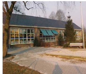
o.b.s. De Westhoek

Zorgverbreding is de uitbreiding en versterking van maatregelen en activiteiten gericht op een meer intensieve zorg voor leerlingen, in het bijzonder voor leerlingen met specifieke pedagogische en/of didactische behoeften. Met de zorgverbreding wordt beoogd om in een zekere hoeveelheid tijd bepaalde, vooraf vastgestelde doelen en tussendoelen te bereiken. De doelen worden vastgelegd in een handelingsplan. Belangrijk hierbij is dat de school steeds een balans zoekt tussen de hulpvraag van het kind en de (on)mogelijkheden van de school .