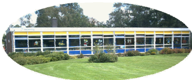
o.b.s. De Aanloop