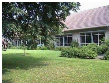
o.b.s. De Zweng

Als na onderzoek blijkt dat de leerling geen specifieke zorg nodig heeft, wordt een leerling toegelaten en ingeschreven. Wordt een vierjarige ingeschreven, dan kunnen voor een kennismaking afspraken worden gemaakt. Meer vindt u in de schoolgids / kalender van de school van uw kind.