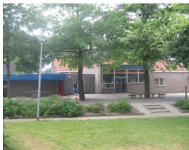
o.b.s. 't Schienvat

Scholen voor kinderen met psychiatrische en gedragsproblemen (zmok-, lzk-scholen voor kinderen met psychische/psychiatrische problemen en pi-scholen): Aanmeldingen: Bureau Aanmelding RENN4: Postbus 26, 9765 ZG Paterswolde, tel. 050 – 309 71 00 Infopunt: 050-5209198 E mail: infopuntgroningen@renn4.nl